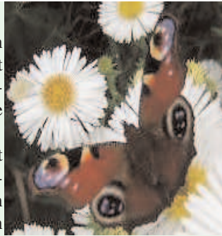
le paon du jour

Sachez que cette plante est indispensable au cycle de reproduction du paon du jour, laissez en pousser un peu dans votre jardin pour ce papillon, espèce en danger.